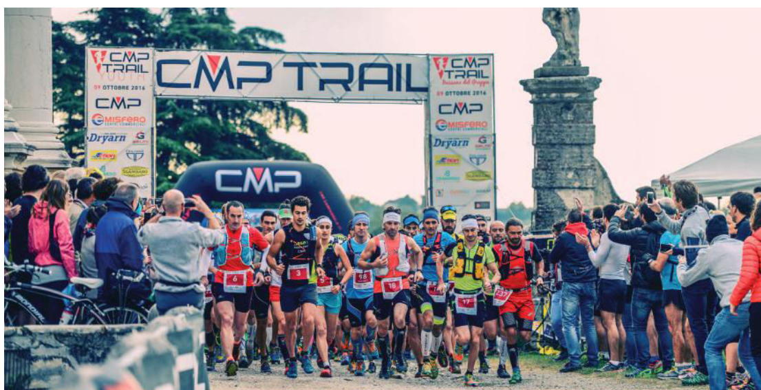
PARTENZA CMP TRAIL 239 RUNNERS SUI 41KM E 462 RUNNERS SUI 16KM

Segnatevi questa data: l'8 ottobre 2017 sarà ancora CMP Trail!